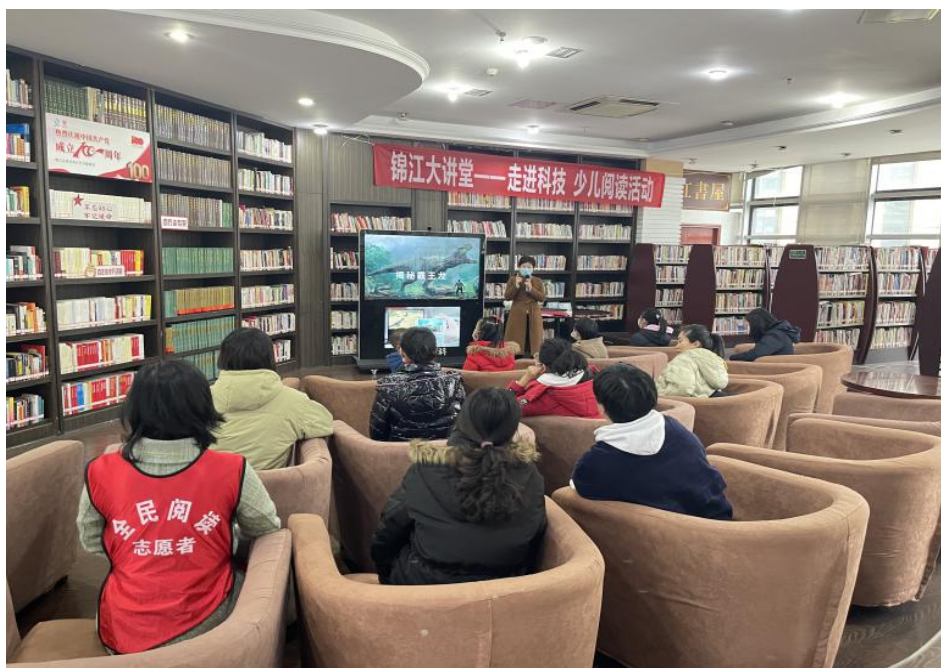
锦江大讲堂“走进科技，少儿阅读”活动