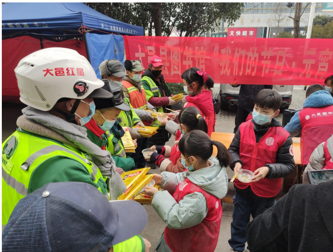
向环卫工人赠送汤圆