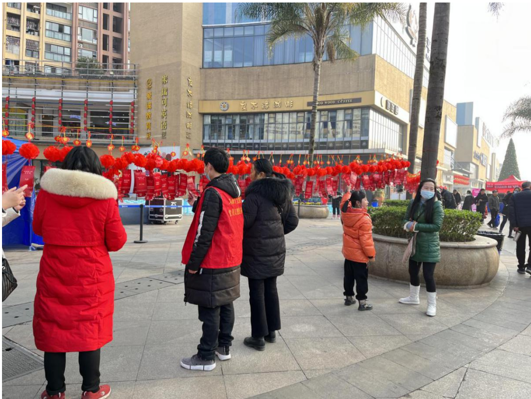
“我们的节日.元宵”猜灯谜活动照片