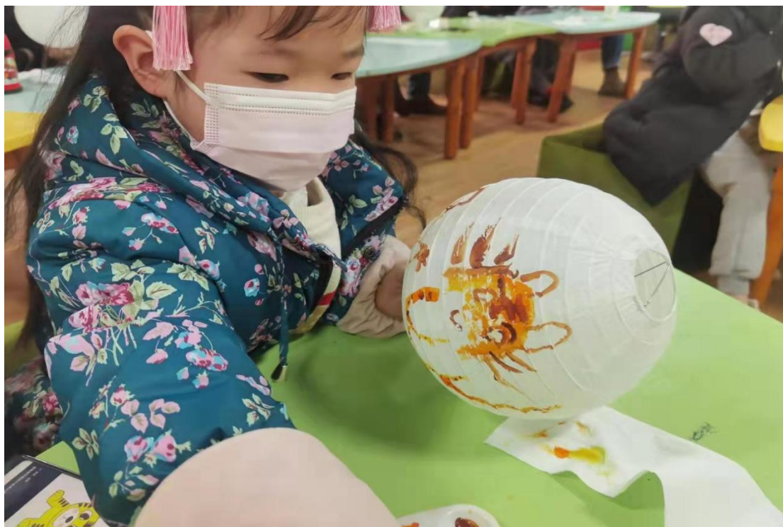
新春非遗绘活动之新春灯笼