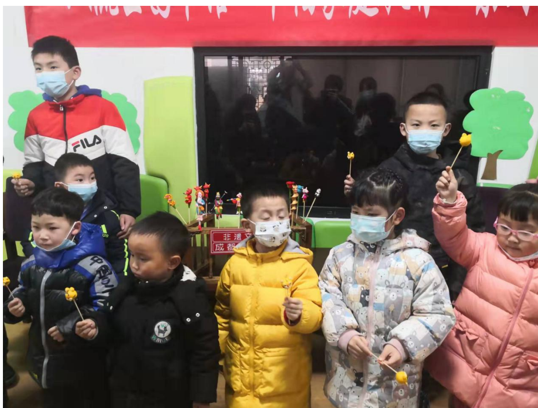
“幸福家庭教育”系列活动非遗手工课之捏面人课堂