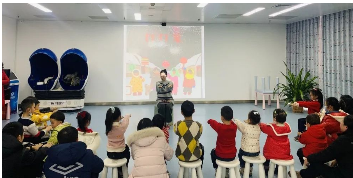
“绘本里的年味” 绘本导读活动