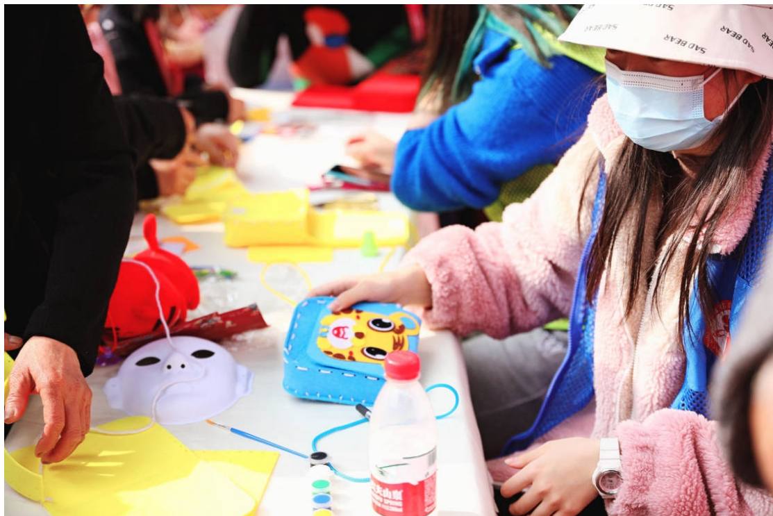
手工制作虎年布包现场