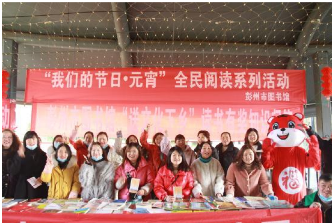
彭州市图书馆“我们的节日·元宵”全民阅读系列活动