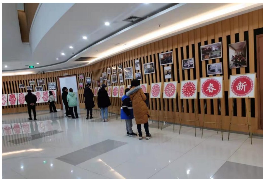
《巧手剪窗花 笑虎迎新年》剪纸作品展