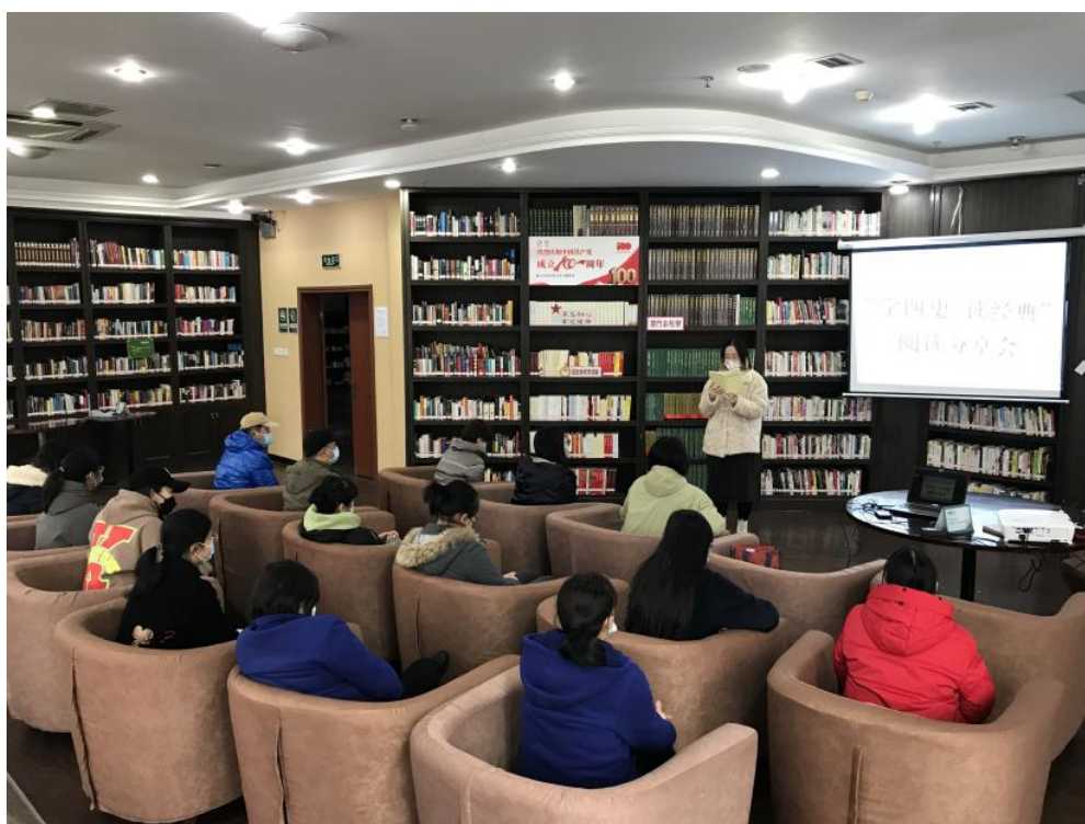
国学经典诵读在锦江——“学四史·读经典”