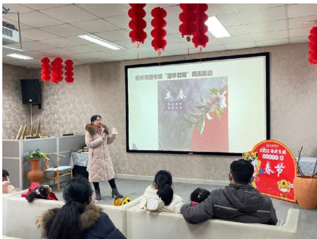
“彭州读”周末活动——《我们的节日与二十四节气》

服务社会”为宗旨，发挥专业特长，提升专业化水平，完善公共数字文化服务体系，使彭州市全民阅读活动长效化、常态化，更好满足广大群众的文化需求。