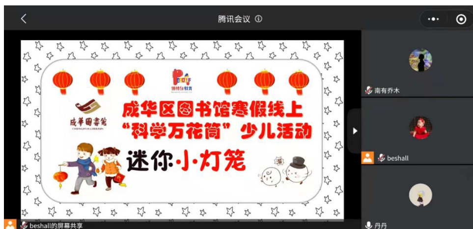
成华区图书馆元宵线上少儿活动二