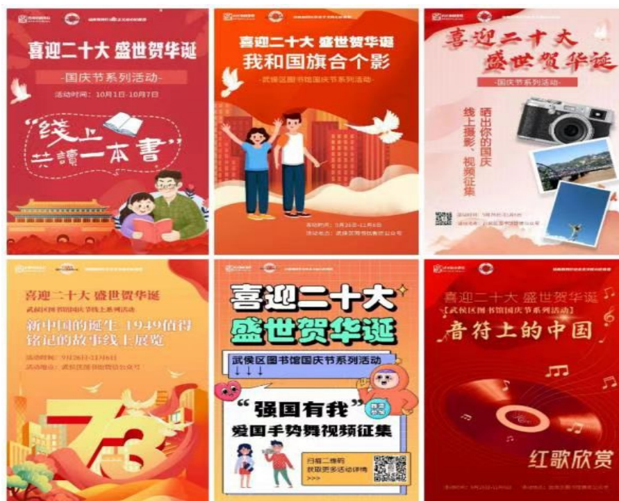
国庆期间线上系列活动