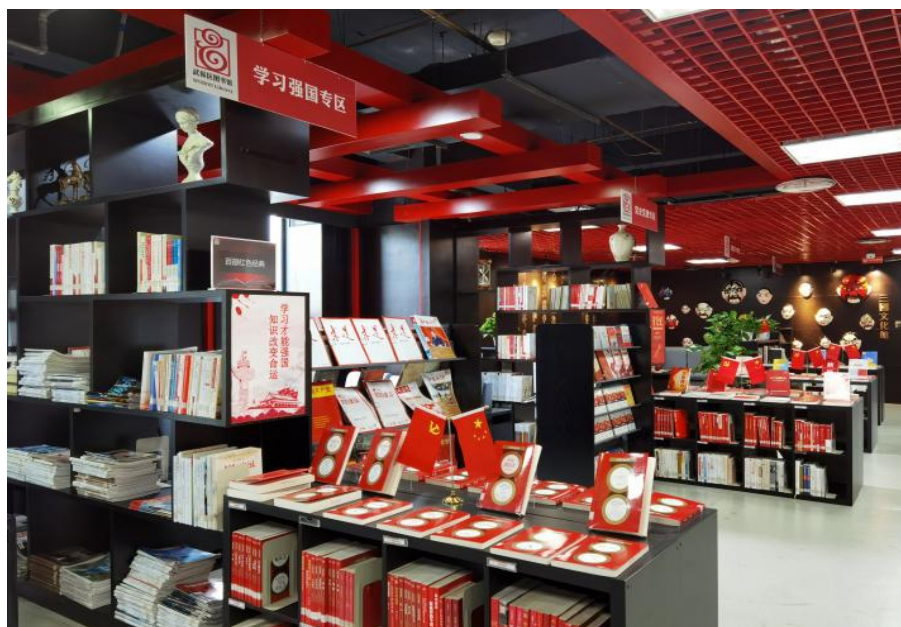
国庆期间主题书柜展示

以万计的读者将享受到免费的“文化大餐”，活动成效显著，将持续丰富读者国庆节的精神文化生活，共贺祖国华诞。