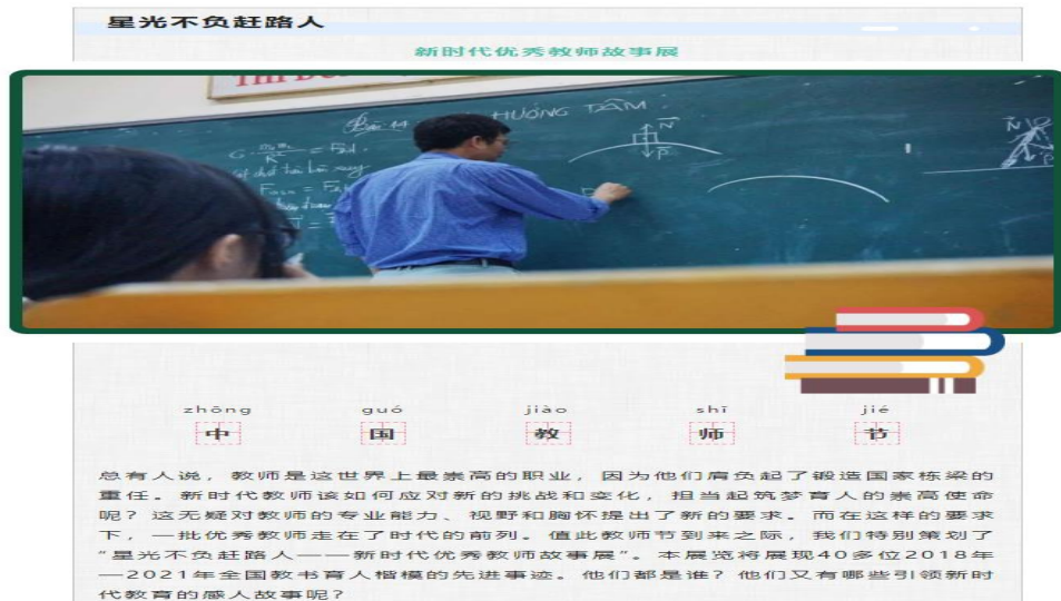
教师节特展：“星光不负赶路人”新时代优秀教师故事展