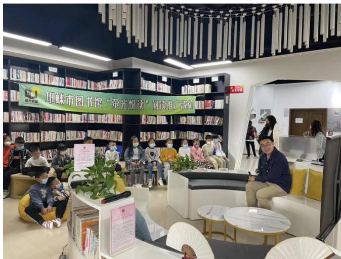
志愿者老师讲解绘本——《瓷器》

本次活动不仅帮助孩子们了解了瓷器，进而领略中国传统文化的魅力，以及在世界发展中的深远影响，而且增强了孩子们的文化自信，也进一步提高了孩子们的阅读兴趣，这也是“萤光悦读”阅读推广活动的创办初衷。