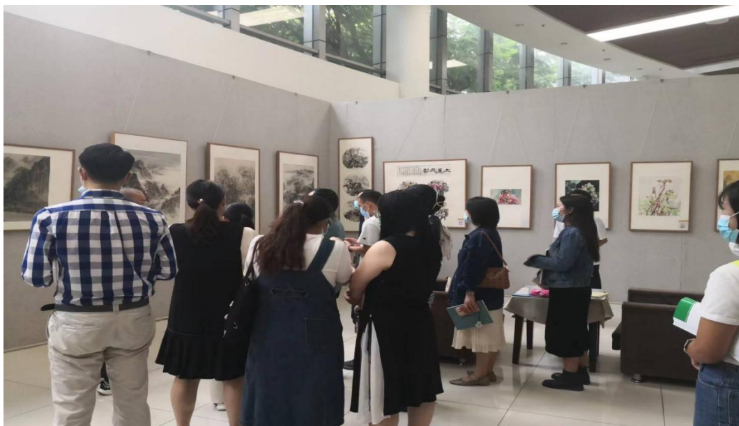
“喜迎二十大·奋进新征程”双流区文化馆公益美术培训 成果作品展